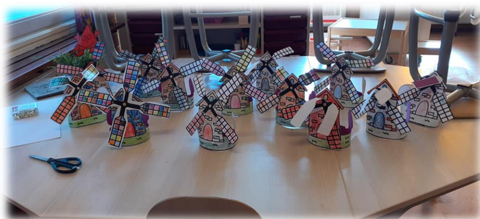
De Zeepaardjes hebben hard gewerkt aan hun Hollandse molens.