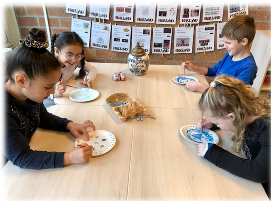
Groep 4 schildert Delfts blauw bordjes. Wat ontzettend mooi!

*De gesprekken voor de leerlingen van groep 1 zijn afhankelijk van het moment dat een kind is ingestroomd in de kleutergroep. De kleuterleerkrachten zullen aangeven of een gesprek in de week van 12 april kan plaats vinden of op een ander moment.